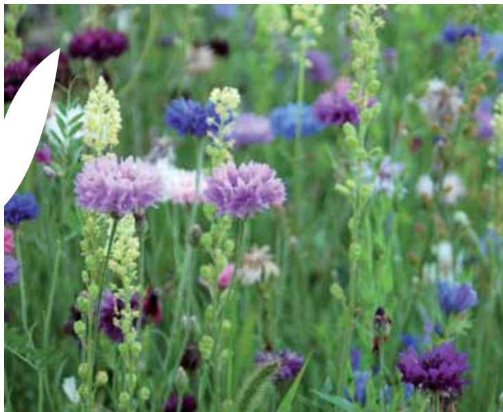
Mélange de centaurees

Gadoum S., Terzo M., Rasmont P., 2007, Jachères apicoles et jachères fleuries : la biodiversité au menu de quelles abeilles ? , Courrier de l'environnement de l'INRA n° 54, septembre 2007 p 57.