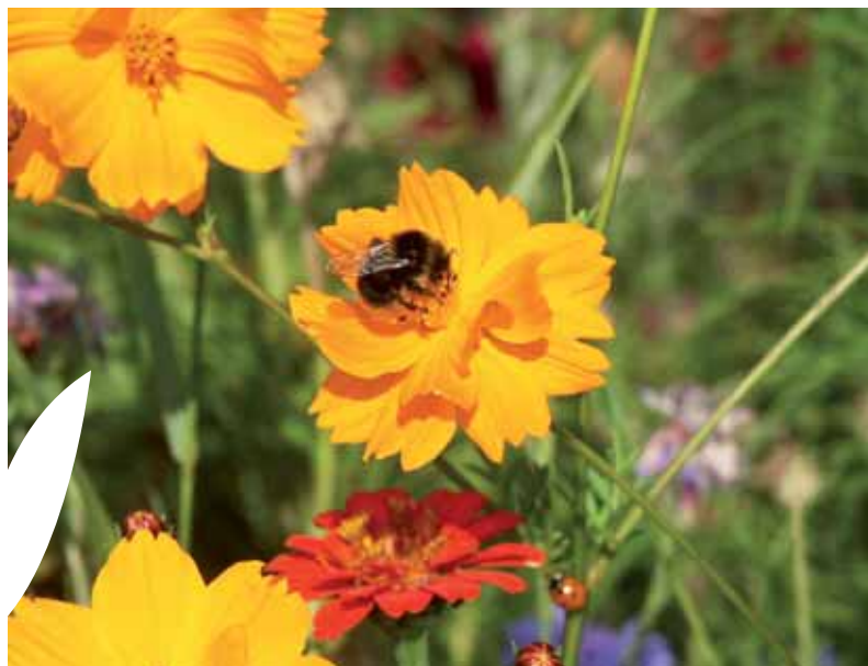
Bourdon sur cosmos

Selon les espèces implantées (annuelles ou pérennes), cet aménagement est favorable à la préservation des sols par la couverture qu'il représente. Cette couverture, en limitant le ruissellement, va contribuer à la préservation de l'eau. Cependant, selon la technique culturale (intrants et traitements), cette contribution est à relativiser.