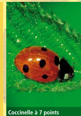
Coccinelle à 7 points