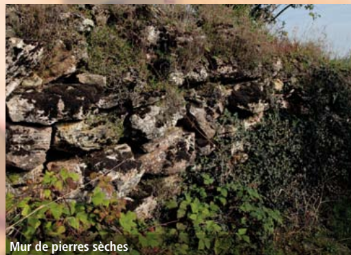
Mur de pierres sèches