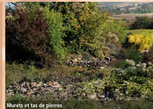
Murés et tas de pierres

Dans certains vignobles pentus, le mur de pierres est utilisé pour protéger les pentes fragiles de l'érosion. L'utilisation de mortier, dans ces cas uniquement, peut s'avérer nécessaire pour la rangée de pierres la plus proche du talus. Il est impératif de laisser les autres rangées libres de tout ciment pour garantir la présence des interstices et fissures indispensables au développement de la faune et la flore.