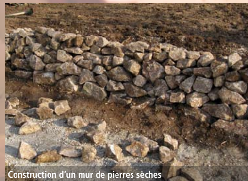
Construction d'un mur de pierres sèches

Le surcreusement du sol évitera un enrichissement trop rapide. La présence de substrats très diversifiés tels que sable, graviers, gros blocs de pierre ainsi que vieilles souches permet d'obtenir diverses vitesses de réchauffement ainsi que de nombreuses niches favorables à la faune. Celle-ci sera d'autant plus variée que le milieu sera diversifié.